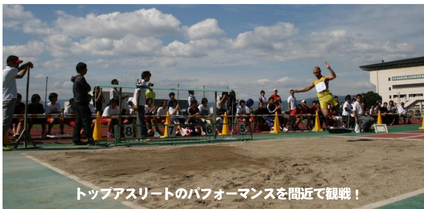
トッパスリートのパフォーマンスを間近で観戦!