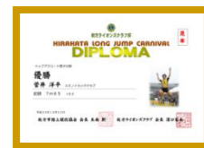
表 彰 各種別6位までに賞状、3位までにトロフィを授与。

実施内容 大会、クリニック共に、下記の参加資格者へは、枚方陸協、小陸研、中体連、高体連等を通じて6月初旬に案内いたします。平成25年6月30日(日)締め切り予定(小学生は7/9まで)