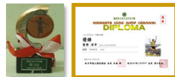
表 彰 各種別6位までに賞状、3位までにトロフィを授与。

会 場 枚方市立陸上競技場(日本陸連3種公認競技場) (大阪府枚方市中宮大池4-10-1 TEL072-848-4899)